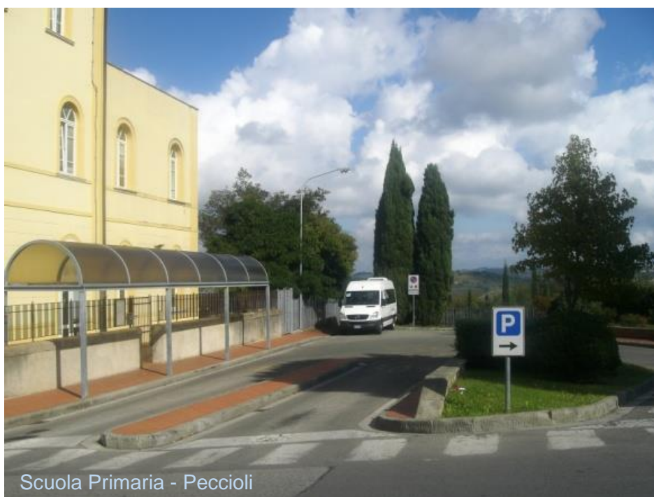
Scuola Primaria - Peccioli